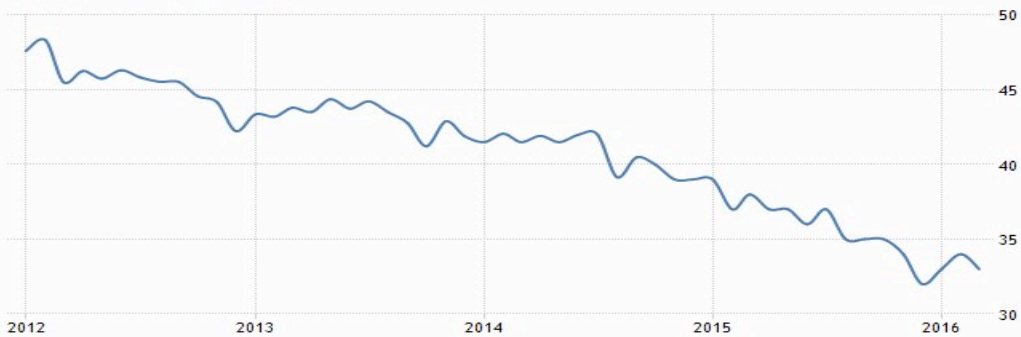
UKRAINE CRUDE OIL PRODUCTION